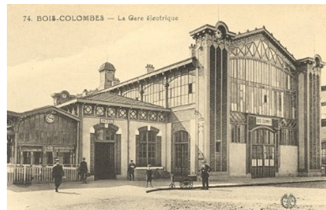
1924 à Asnières (Gare de Bois-Colombes)

Histoire de ce bâtiment et de sa sauvegarde illustrée de plus de 130 documents et d'un rare « Film Lumière » de 1897 (1)